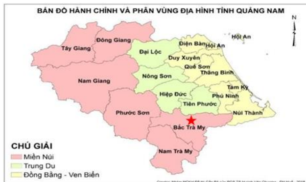
Hình 1. Vị trí vùng nghiên cứu